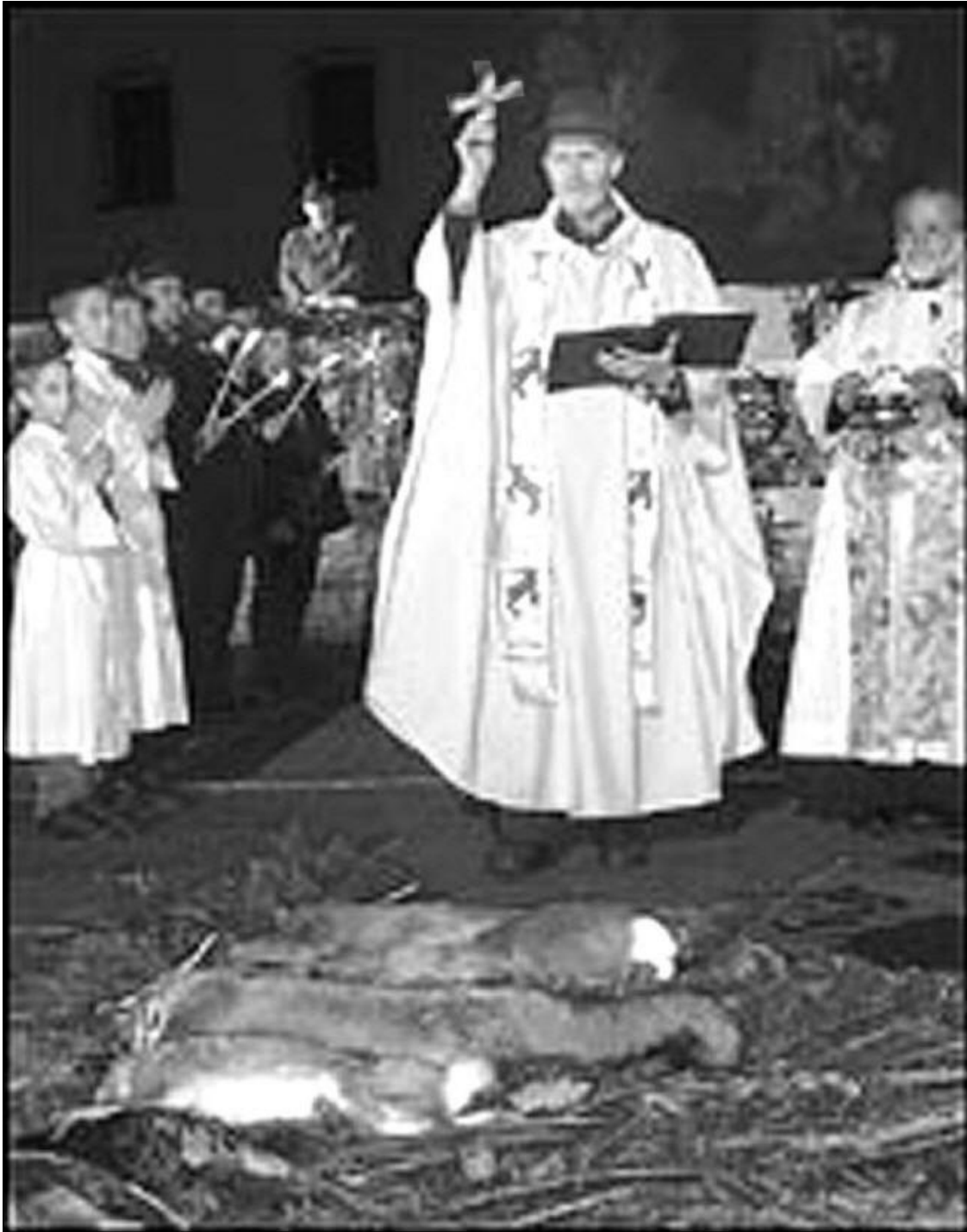
Hubertusmesse: Ein Priester segnet Jagd, Jäger und die von Jägern erschossenen Tiere.

http://www.freiheit-fuer-tiere.de/broschueren-filme-musik/dertierleichenfresser/millionenfaches-tierleid-.html