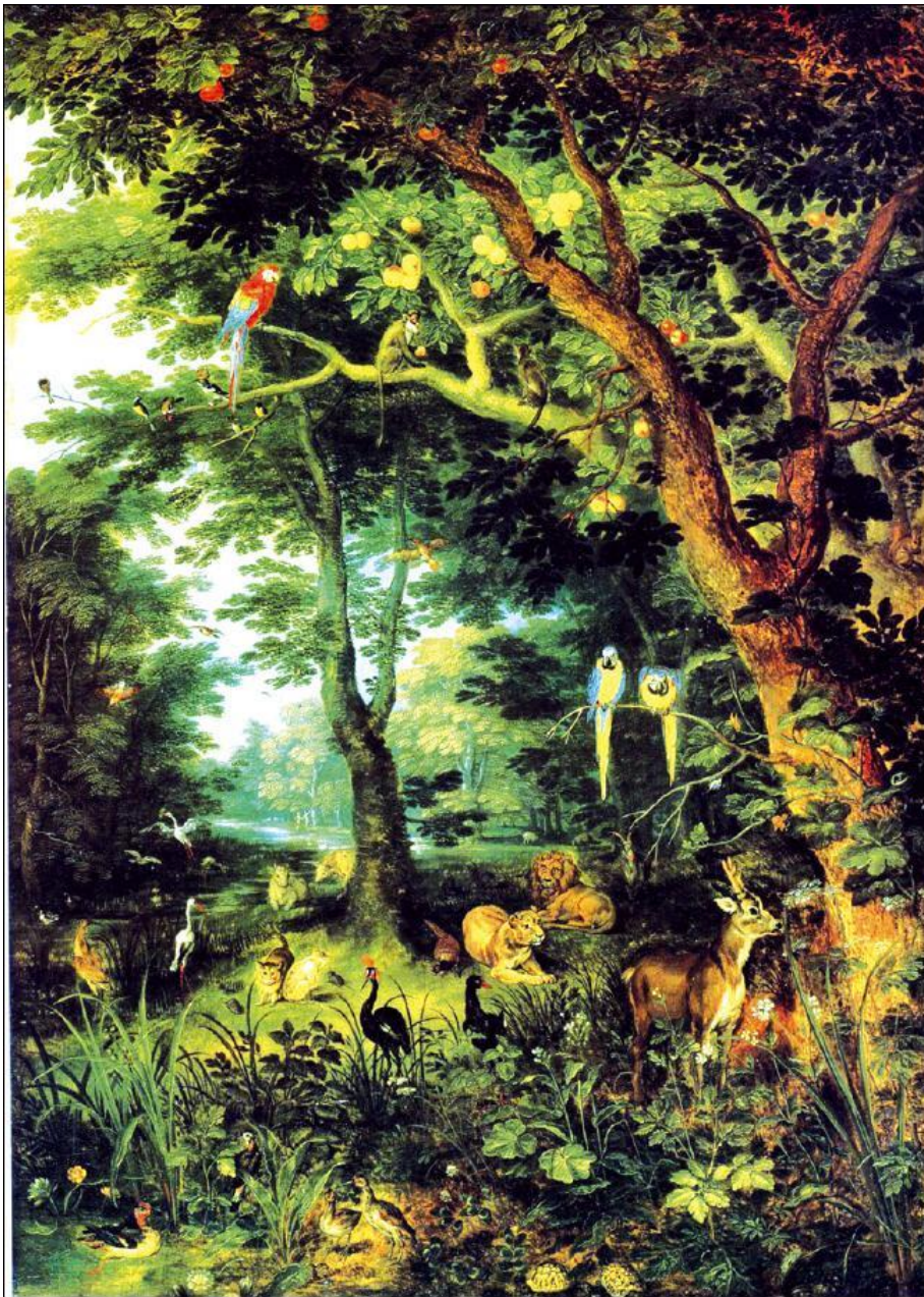
Das Paradies Jan Bruegel (1568- 1625)

Dass die Tiere in unserer Gesellschaft millionenfach so unsagbar leiden müssen, ist nicht zuletzt auf die tierfeindliche Lehre der Kirchen zurückzuführen. Denn die Kirchenlehre rechtfertigt bis heute Massentierhaltung, Tiertransporte, Schlachthöfe, Tierversuche und Jagd. Bis heute sprechen beide Kirchen den Tieren die unsterbliche Seele ab. Seit dem 4. Jahrhundert, als die entstehende römische Machtkirche das Urchristentum verdrängte, ist die Kirche gegen die Tiere - und dies, obwohl Jesus von Nazareth die Tiere liebte und die ersten Christen Vegetarier waren.